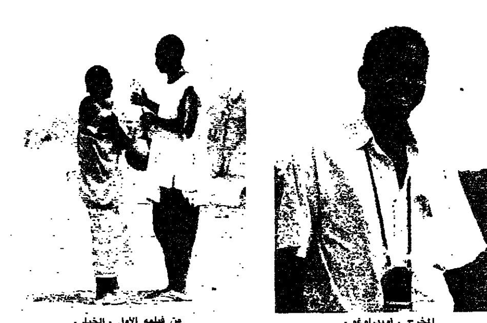
من فيلمه الأول «الخيار»

مشكلة السينما في البلدان النامية والفقيرة واحدة، فهي ليست من الأولويات في سلم الاهتمامات لدى الدولة، وان شجعت الإنتاج السينمائي احيانا فلما يكون ذلك في شكل غير كاف لدعم المواهب والافادة من امكانياتها.